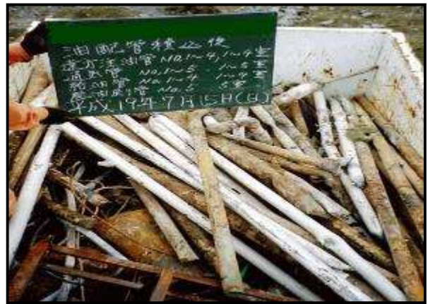
* 運搬車両に配管を積込した写真